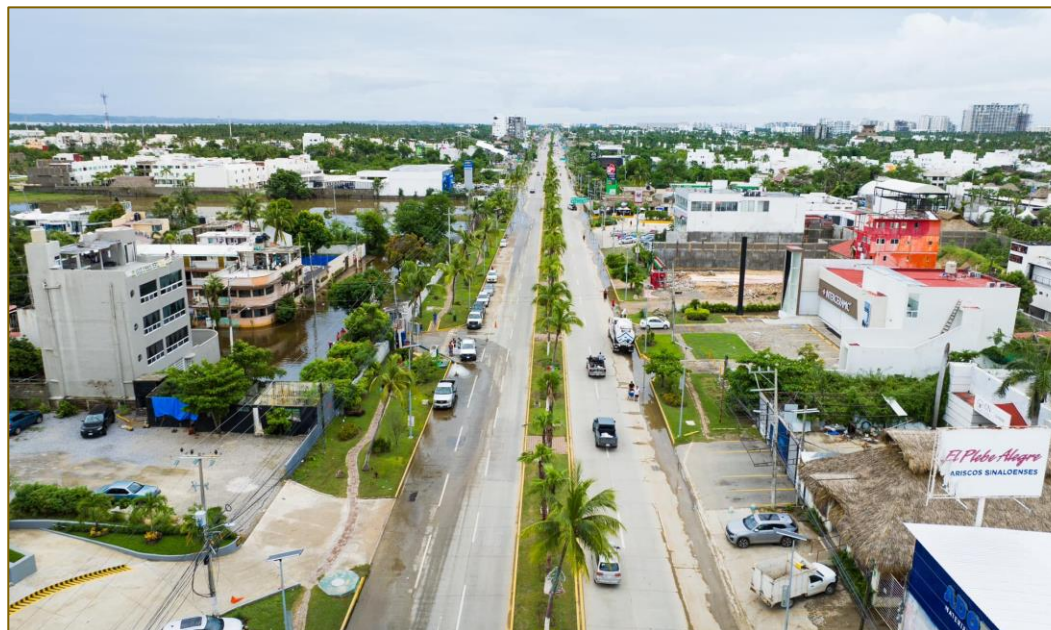
Boulevard de las Naciones, Zona Diamante Acapulco. Domingo, 29 septiembre, 2024