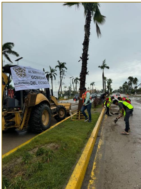
Boulevard de las Naciones, Zona Diamante Acapulco. Sábado 28 septiembre, 2024